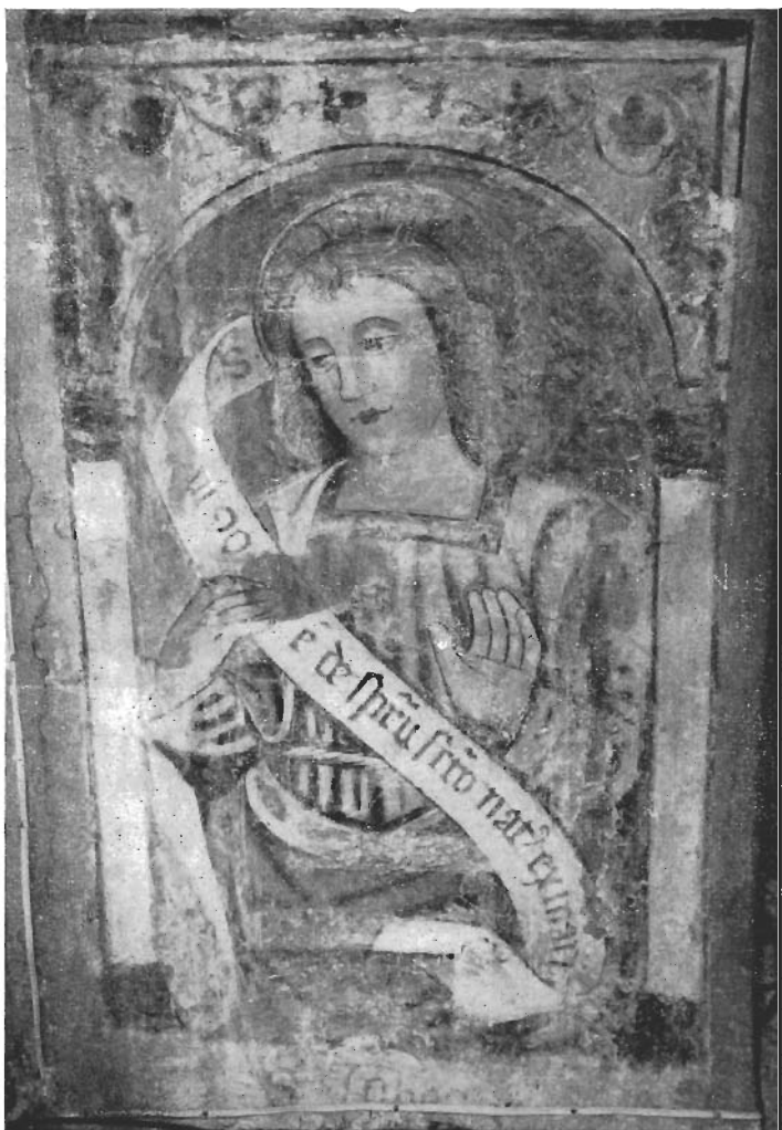
Affresco dell' Antica Chiesa