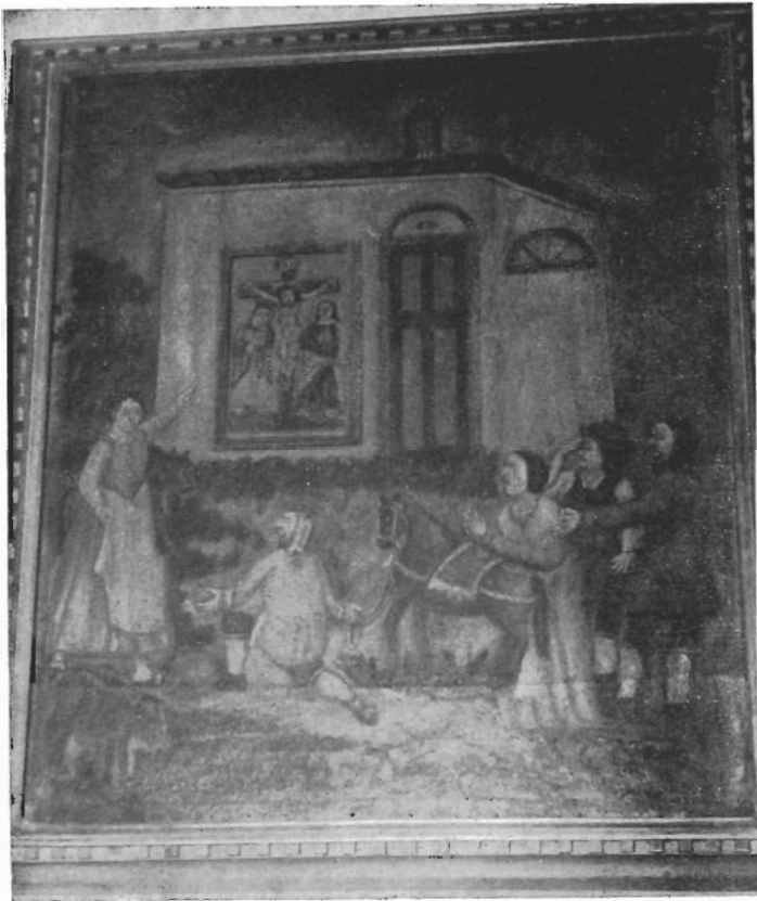
Antichissimo Tempietto di S. Maria (da una stampa dell'archivio)