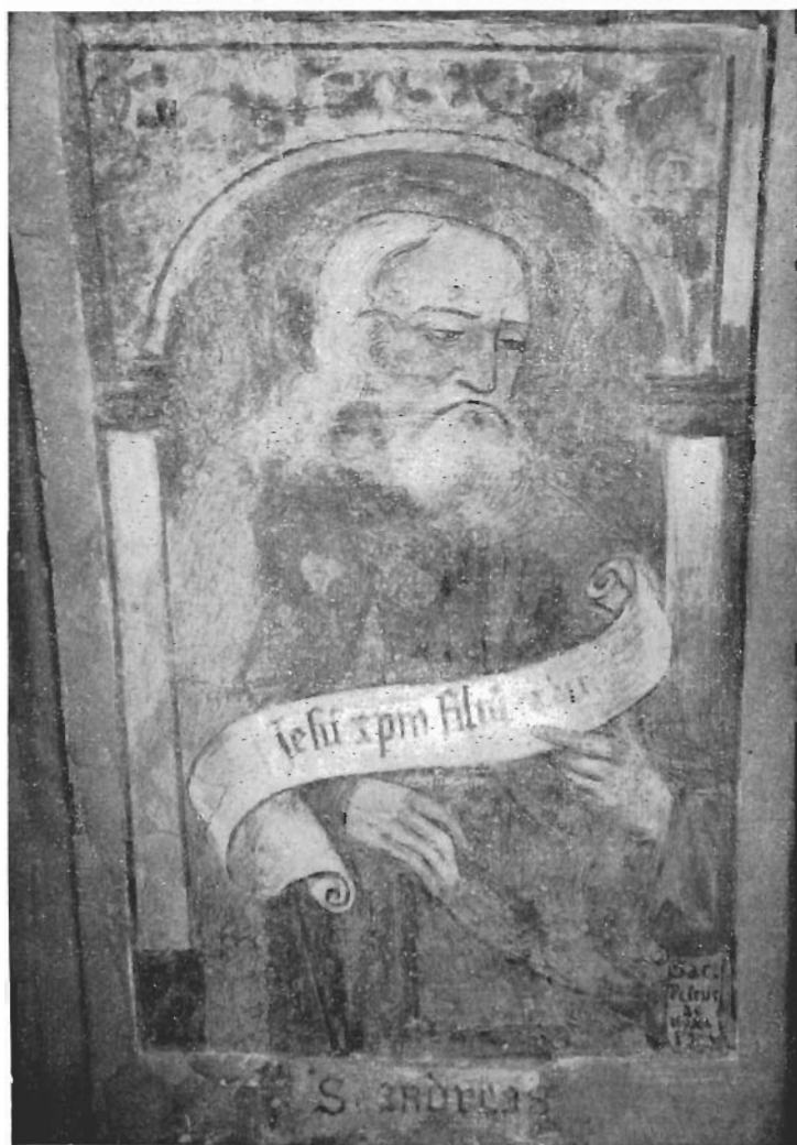
Affresco dell' Antica Chiesa