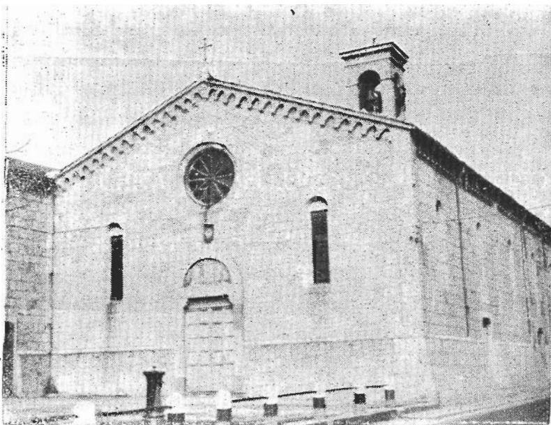
Facciata del Tempio