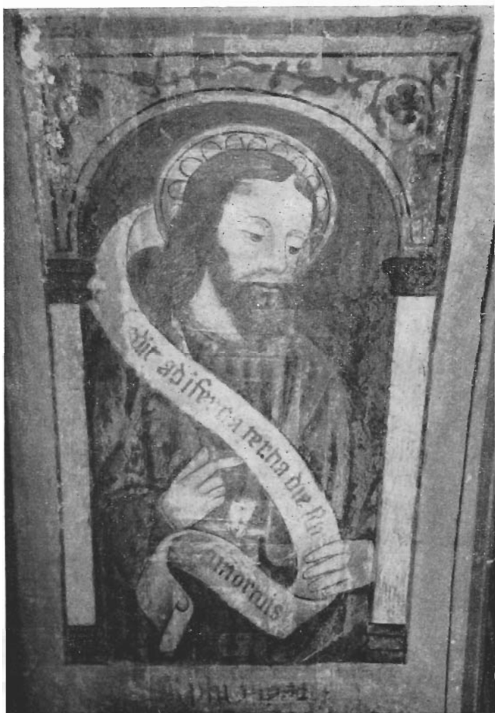
Affresco dell' Antica Chiesa