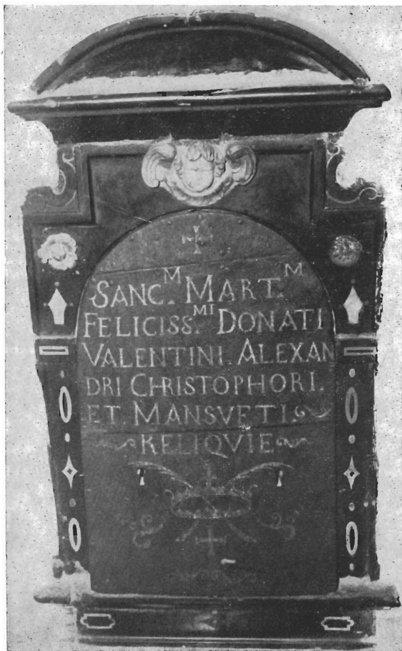
In loculo dietro l'Altare Maggiore, col nome dei SS. Martiri